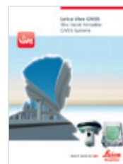
Leica Viva GNSS Брошюра продукта