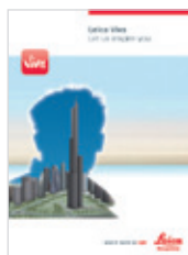
Leica Viva Обзорная брошюра

Иллюстрации, описания, технические характеристики не прилагаются. Printed in Switzerland – Copyright Leica Geosystems AG, Heerbrugg, Switzerland, 2009. 774666ru – VI.13 – galledia