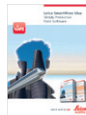
Leica SmartWorx Viva Брошюра продукта